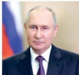
ПУТИН ВЛАДИМИР ВЛАДИМИРОВИЧ

1952 года рождения; место жительства – город Москва; Президент Российской Федерации; самовыдвижение