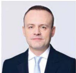
ДАВАНКОВ ВЛАДИСЛАВ АНДРЕЕВИЧ

1984 года рождения; место жительства – город Москва; Государственная Дума Федерального Собрания Российской Федерации, депутат, заместитель Председателя Государственной Думы, член Комитета Государственной Думы по бюджету и налогам; выдвинут политической партией «Политическая партия «НОВЫЕ ЛЮДИ»; член политической партии «Политическая партия «НОВЫЕ ЛЮДИ»; член Центрального совета партии