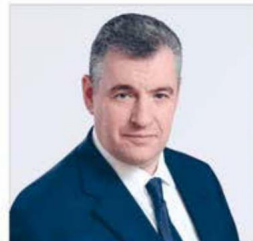
СЛУЦКИЙ ЛЕОНИД ЭДУАРДОВИЧ

1968 года рождения; место жительства – город Москва; Государственная Дума Федерального Собрания Российской Федерации, депутат, руководитель фракции Политической партии ЛДПР – Либерально-демократической партии России, председатель Комитета Государственной Думы по международным делам; выдвинут политической партией «Политическая партия ЛДПР – Либерально-демократическая партия России»; член политической партии «Политическая партия ЛДПР – Либерально-демократическая партия России»; Руководитель Высшего Совета партии, Председатель партии