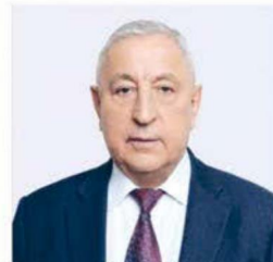
ХАРИТОНОВ НИКОЛАЙ МИХАЙЛОВИЧ

1948 года рождения; место жительства – город Москва; Государственная Дума Федерального Собрания Российской Федерации, депутат, председатель Комитета Государственной Думы по развитию Дальнего Востока и Арктики; выдвинут политической партией «Политическая партия «КОММУНИСТИЧЕСКАЯ ПАРТИЯ РОССИЙСКОЙ ФЕДЕРАЦИИ»; член политической партии «Политическая партия «КОММУНИСТИЧЕСКАЯ ПАРТИЯ РОССИЙСКОЙ ФЕДЕРАЦИИ»; член Центрального Комитета партии, член Президиума Центрального Комитета партии