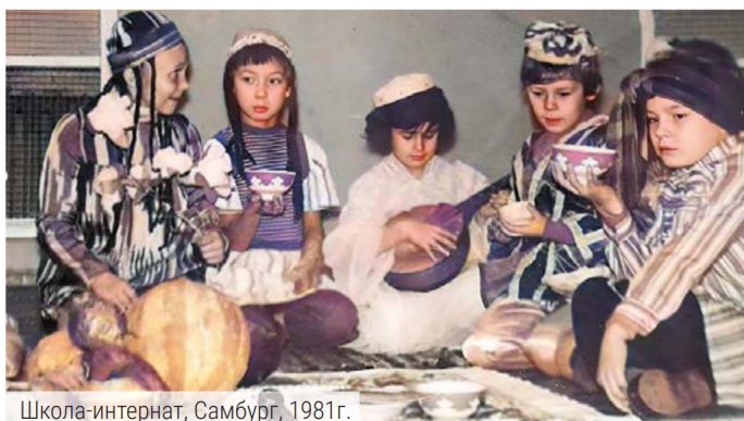
Школа-интернат, Самбург, 1981г.

Профессионально «сажению по бели» не учат, так как нет высокой потребности. Это раньше у каждой русской девушки из обеспеченной семьи был личный венец. Он равнялся стоимости дома, считался хорошим капиталовложением. Сейчас этот головной убор находится в